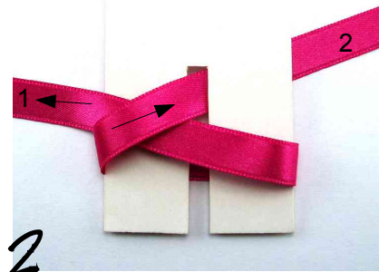
2 L'extrémité 2 est passée au dessus de l'extrémité 1, puis dans l'encoche