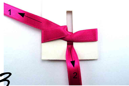
3 L'extrémité 2 est ramenée en bas de l'encoche