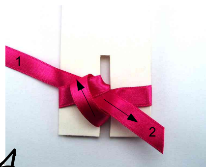
4 L'extrémité 2 est passée dans la boucle (du haut vers le bas)