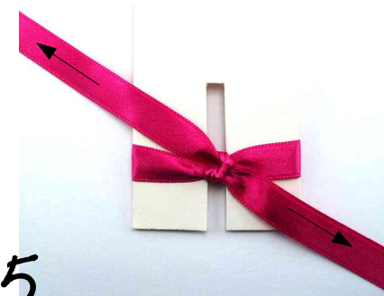
5 Tirez sur les 2 extrémités. Serrez bien. Dégagez le nœud du gabarit

Vous venez de réaliser un nœud parfait !!